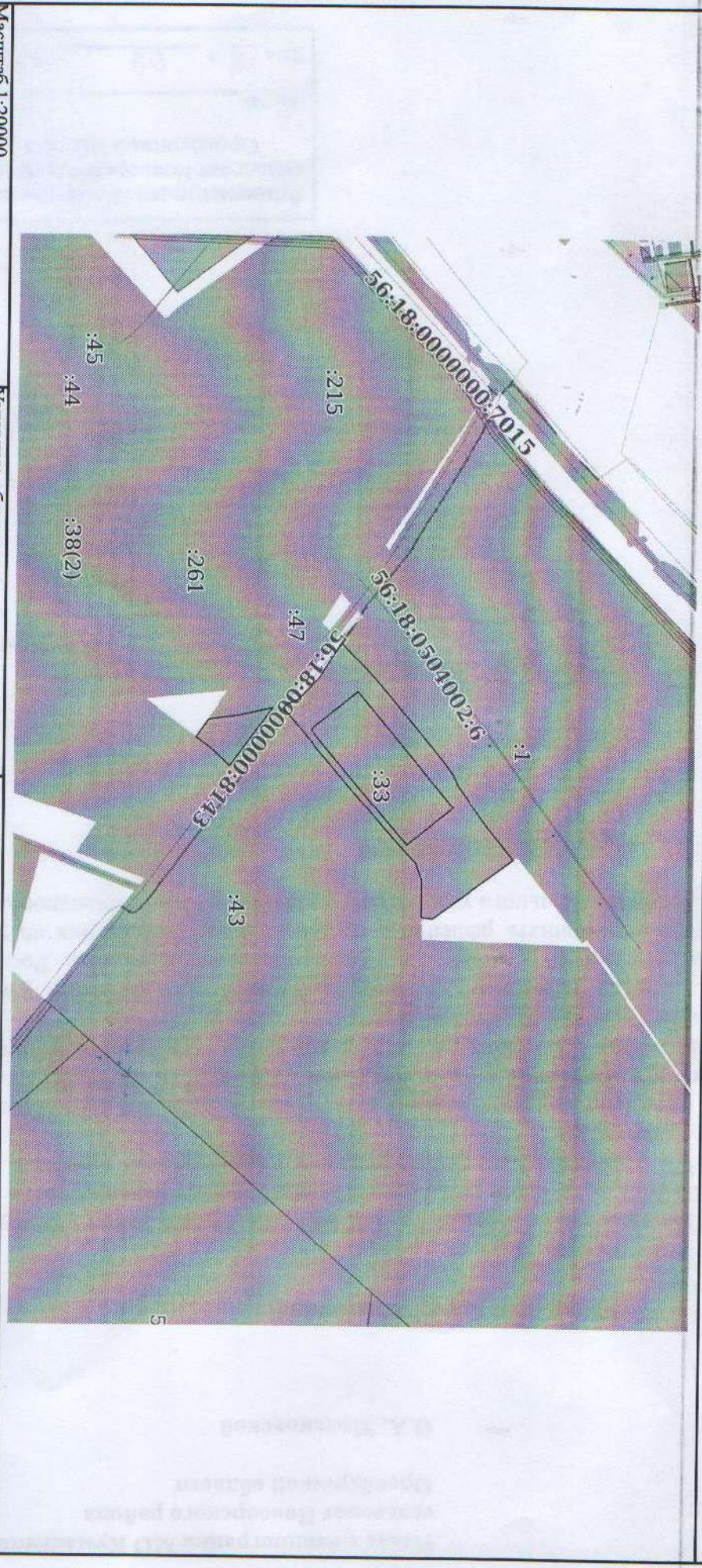
План (чертеж, схема) земельного участка